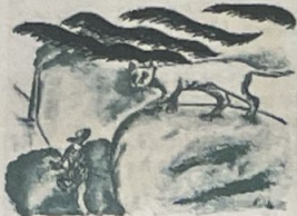
Enzo Cucchi - Al buio sul mare Adriatico

Va ad Achille Bonito Oliva il Premio Capua Follaro d'Oro 2005. Ad introdurre la cerimonia una serie di eventi propedeutici, inaugurati con la mostra "Il libro della transavanguardia", presso il Museo Provinciale